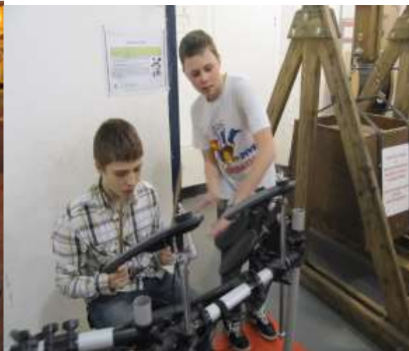
Экспоцентр «Фестиваль науки» Москва