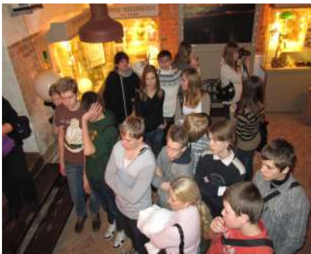
Музей «Огни Москвы»