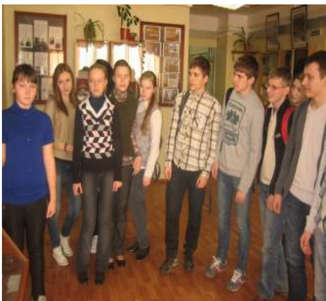
Экскурсия для старшеклассников.