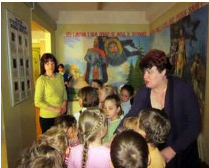
Музей для дошколят.