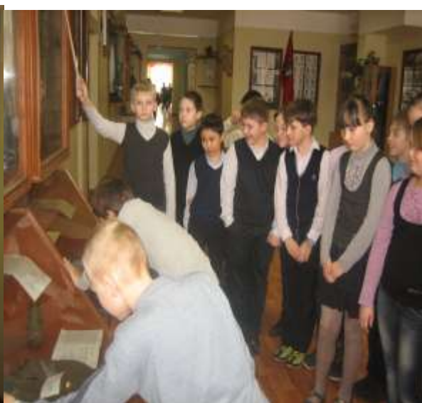
Экскурсия для начальной школы.